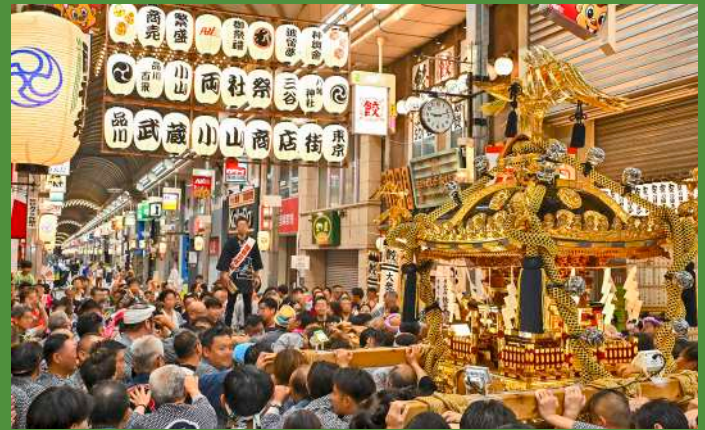
第37回小山両社祭が開催されました(令和6年9月1日)