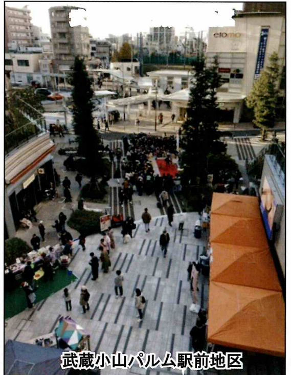
武蔵小山パルム駅前地区

組合事務所：品川区小山三丁目26番9号 駅サイドビル6階 連絡先：03 - 6426 - 7133