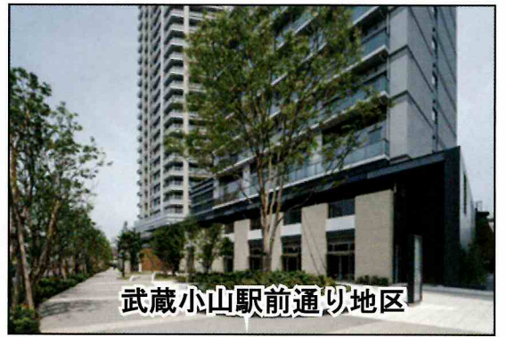
武蔵小山駅前通り地区

組合事務所：品川区小山台一丁目22番8号 昭和ビル2階 連絡先：03 - 6426 - 6922