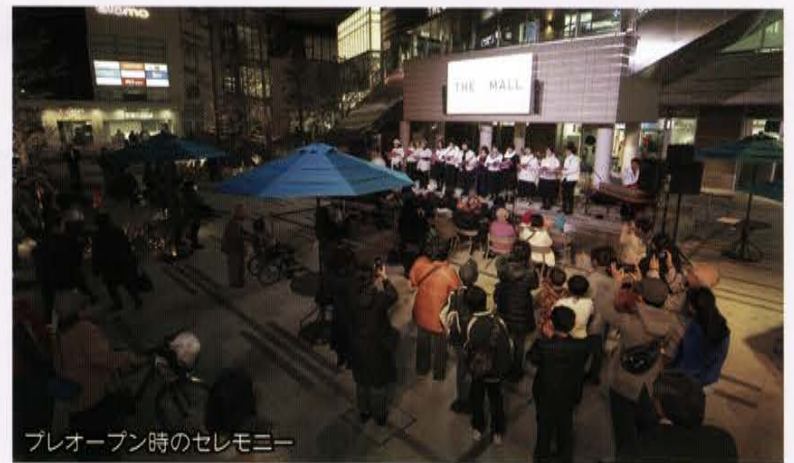
プレオープン時のセレモニー

このたび、2019年12月に武蔵小山パルム駅前地区（パークシティ武蔵小山）の施設建築物新築工事が竣工を迎えました。品川区の西の玄関口・荏原地区の中心核として、商業・住居機能の強化を図り、憩いと賑わいをもたらす広場を中心に、地域貢献として商店街利用のための公共的駐輪場、子育て支援となる認可保育所、さらに災害時に物資を提供する備蓄倉庫等を備えています。今後も地域の皆さまの愛される施設となるよう、様々なイベント等を行い、賑わいのある場づくりに向けてまちづくりを進めていきます。