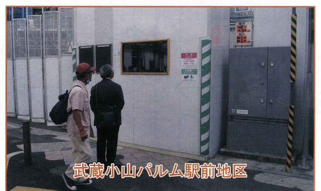
武蔵小山パルム駅前地区